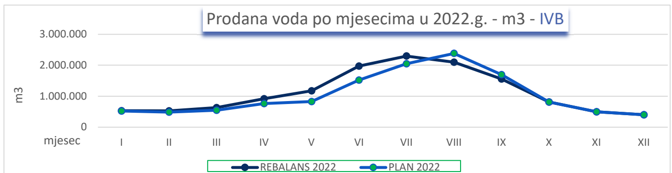
Graf 1: Prodaja vode po mjesecima u 2022. godini

Realizacija prodane vode iznad je planiranih vrijednosti do kolovoza 2022. kad je uvođenje djelomične redukcije u isporuci vode rezultiralo smanjenom potrošnjom, prvenstveno u kategoriji industrijskih potrošača (turističkih kapaciteta), dok se do kraja godine očekuje ostvarenje planiranih vrijednosti uz ukupno ostvarenje porasta prodaje za 7% odnosno 914 tis m 3 .